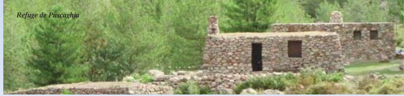
Refuge de Puscaghja

PARC NATUREL RÉGIONAL DE CORSE Parcu di Corsica